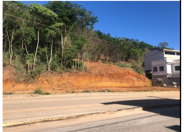
Figura 4 – Bem avaliando.