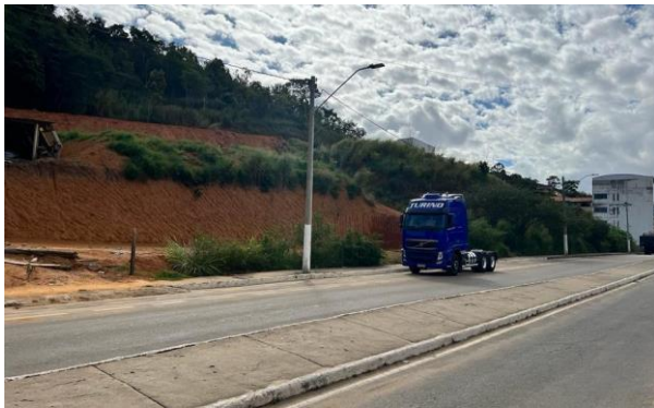
Figura 11 – Bem avaliando.