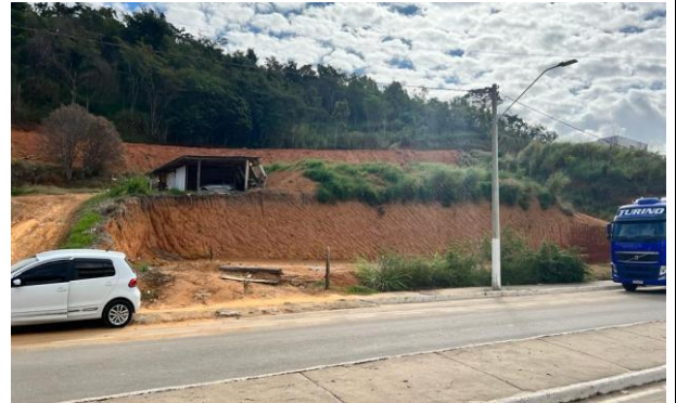
Figura 10 – Bem avaliando.