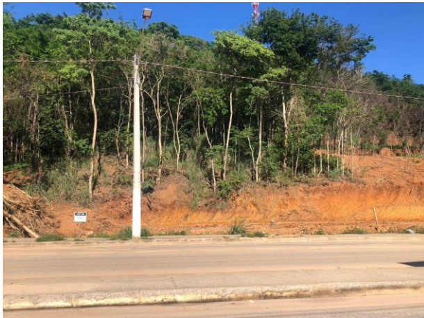
Figura 3 – Bem avaliando.