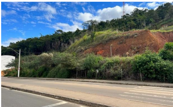
Figura 13 – Bem avaliando.