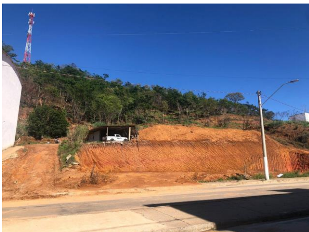
Figura 5 – Bem avaliando.