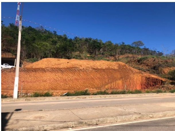
Figura 7 – Bem avaliando.