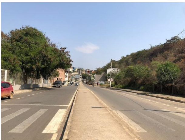
Figura 1 - Avenida Antônio Augusto de Oliveira.