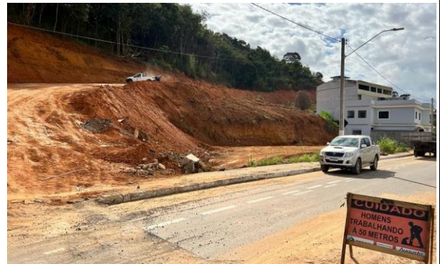
Figura 12 – Bem avaliando.