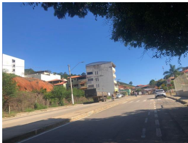
Figura 2 – Avenida Antônio Augusto de Oliveira.