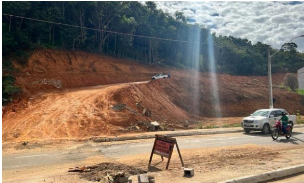
Figura 9 – Bem avaliando.